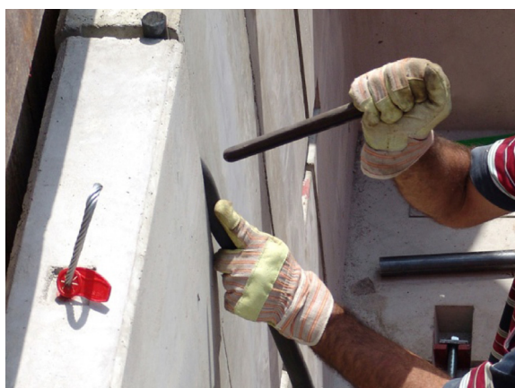
Querfugen mit Dichtgummis abdichten