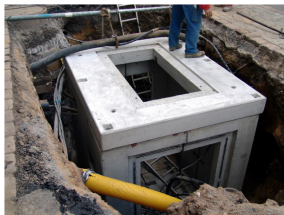
Die Deckenplatte vorschriftsmäßig anschlagen, passgenau über die Stahldollen führen und auf dem Schacht absetzen und ausrichten.