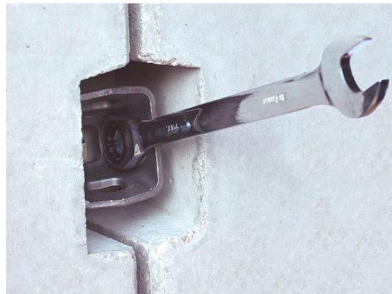
Schachtelemente mit Schraubensätzen verbinden