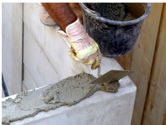
Die Lagerfläche säubern und ein Mörtelbett herstellen.