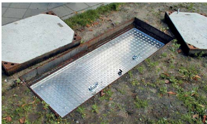
WASI- Alu mit zwei Aushebegriffen (Bild: P-IV 160/50 cm i.L.)